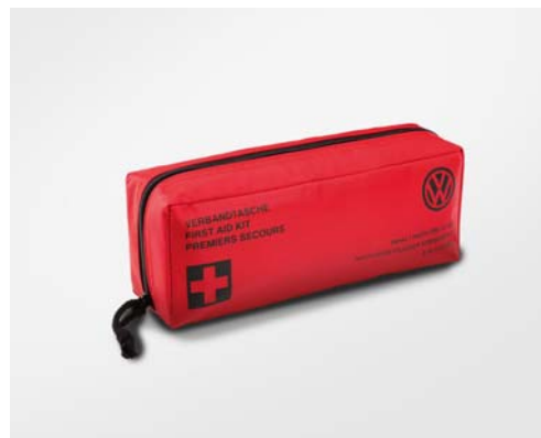
Oryginalne akcesoria Volkswagen® Apteczka samochodowa Zgodnie z aktualnymi przepisami obowiązkowy element wyposażenia samochodu. Art. nr: 6R0 093 108