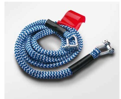
Oryginalne akcesoria Volkswagen® Linka holownicza Jakość potwierdzona w badaniach TÜV. Dopuszczalne obciążenie: 2500 kg. Art. nr: 000 093 014