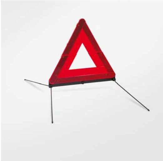
Oryginalne akcesoria Volkswagen® Trójkąt ostrzegawczy Składany trójkąt o podstawie pająkowej. Obowiązkowe wyposażenie każdego pojazdu. Art. nr: 000 093 057