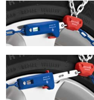
Szczegóły Wystarczy jeden ruch, by otworzyć: funkcja „Quick Release” ułatwia demontaż.