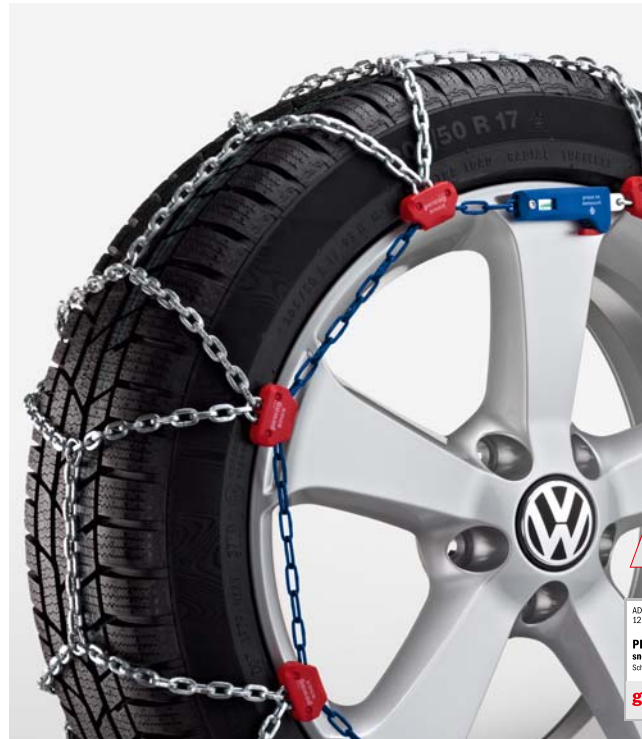
Oryginalne akcesoria Volkswagen® Łańcuchy śniegowe „Snox” (firmy Pewag) System automatycznego napinania zapewnia najprostszy i jedyny taki na rynku montaż łańcuchów (wystarczy nasunąć je na koło, napinanie odbywa się automatycznie). Po zatrzymaniu pojazdu blokada łańcuchów zostaje zwolniona. Można je zdemontować jednym pociągnięciem w każdej pozycji koła. W zestawie torba. Teraz nowość: funkcja „quick release” ułatwiająca demontaż łańcucha. Art. nr: 000 091 387 AB